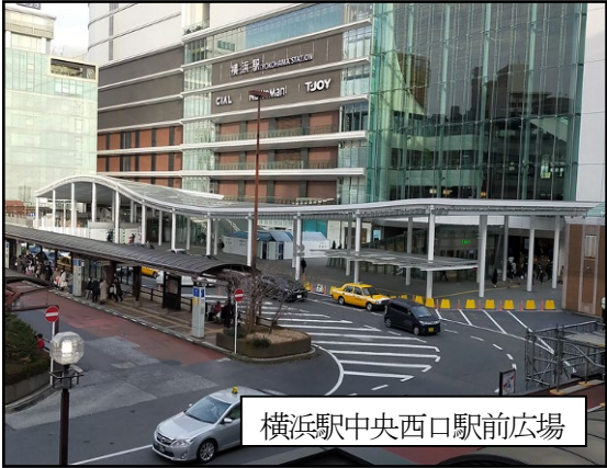
横浜駅中央西口駅前広場