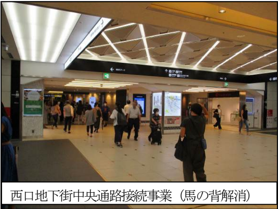
西口地下街中央通路接続事業（馬の背解消）