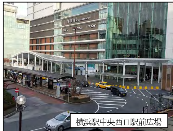
横浜駅中央西口駅前広場