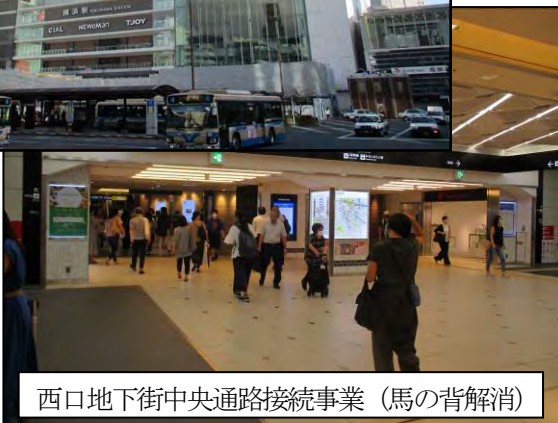
西口地下街中央通路接続事業(馬の背解消)