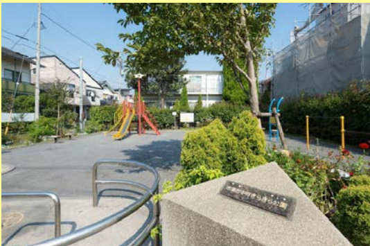
【市場西中町きらきら公園】