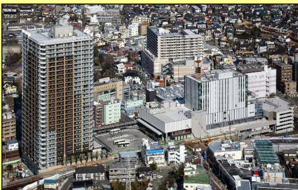
【二俣川駅南口地区第一種市街地再開発事業】

平成15年に「防災上課題のある密集住宅市街地」として、市から選定されたことをきっかけに防災まちづくりの取組を始めました。地域が一体となり、粘り強く地権者や関係機関へ働きかけることで、道路拡幅を実現、防災設備を備えた公園の整備や「通り名プレート」の設置等、多くの成果をあげています。