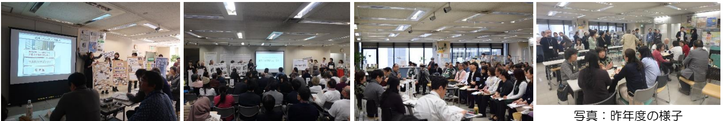
写真：昨年度の様子

「ヨコハマ市民まち普請事業」：市民が地域の課題解決や魅力向上を図るための施設整備費を助成する事業。 二段階の公開コンテストで選考された提案に対して、最大500万円の整備助成金を交付します。