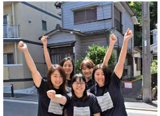
おもいやり隊と多世代交流拠点

※「おもいやり隊」は横浜市の認証を受け「NPO法人 おもいやりカンパニー」として今後も地域に根差した活動を続けていきます。