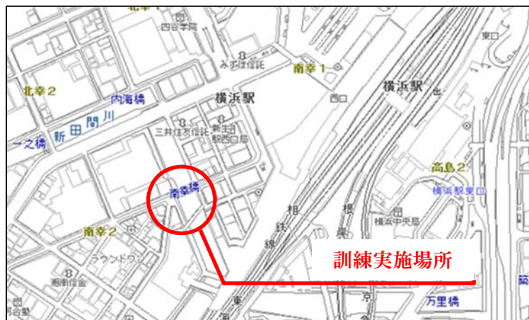
図1 訓練実施位置図

URL： https://www.city.yokohama.lg.jp/kurashi/machizukuri-kankyo/toshiseibi/toshin/excite22/topic2/topics.html