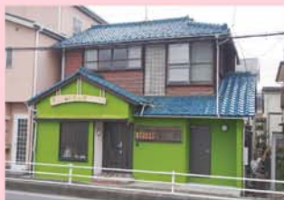
「人材マップ」を活用した交流拠点