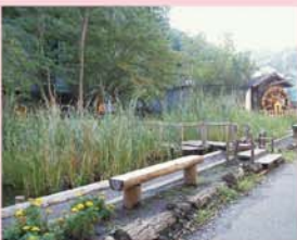
小学校の中の総合学習の場