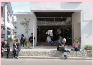
多世代・多国籍の方々が集う場所