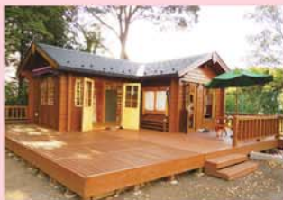
公園の中の見守り合いの拠点