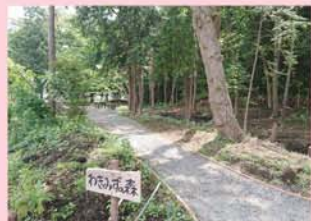
森と泉の憩いの場