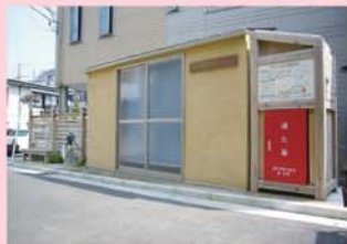
地下貯水槽と手押しポンプ