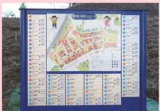
まちの魅力を発信するエリアマップ