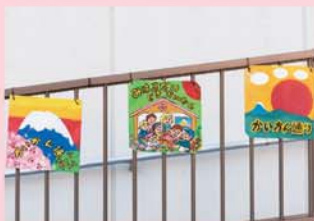
道路の愛称入りサイン