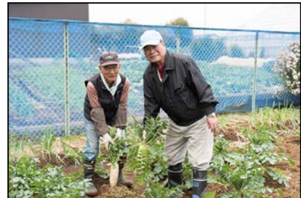
六ツ川野外サロン（南区） 農作業を通じて楽しみながらお互いに 見守り合う関係づくりが生まれる。