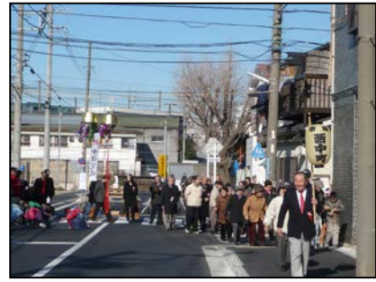
鶴見区市場西中町まちづくり協議会（鶴見区） 地域の地道な活動で歩道の拡幅、広場づくりなど 防災面で多くの成果を上げる。