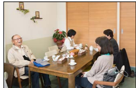
コミュニティだんだん（泉区） 地域の方が主役となって 生き生きと活躍できる場を提供。