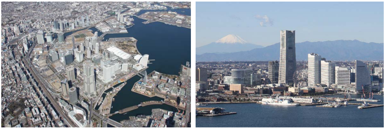
平成29年の来街者数、就業者数及び事業所数

平成29年のみなとみらい21地区における年間来街者数は、約7,900万人となりました。また、就業者数は約10万5千人、事業所数は約1,810社と、共に過去最多となりました。