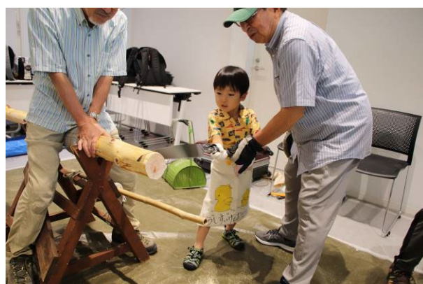
【 水源林の間伐材で丸太切り体験 】