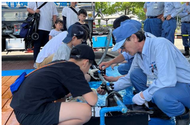
【 漏水修理体験コーナー 】