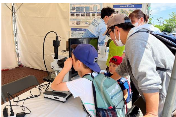
【 顕微鏡をのぞいて水質検査を体験 】