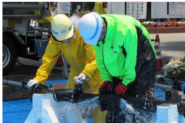
【 水道局職員による漏水修理の実演 】