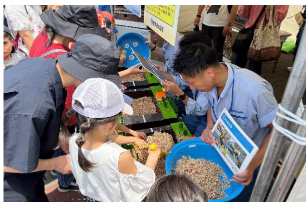
【 遊びながら水道管取替え工事を体験 】