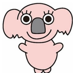
金沢動物園キャラクター 「金沢ゆーかりん」