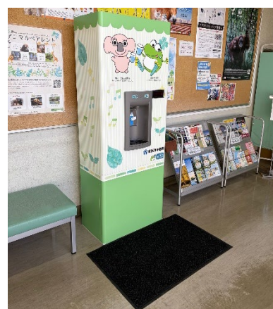
給水スポット写真(アップ)