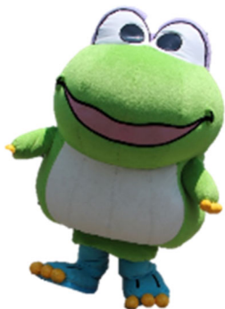
横浜市水道局キャラクター はまピョン