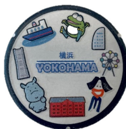
グッズイメージ (マグネット)