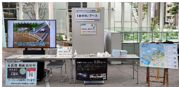
昨年度のイベントブース写真

横浜の水循環について、パネルや動画で紹介します。また、対象ブースで条件を満たすと手に入るシールを全て集めることで、水の日各種グッズが当たるガチャを回すことができます。