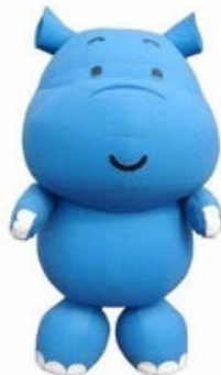
横浜市水環境キャラクター かばのだいちゃん