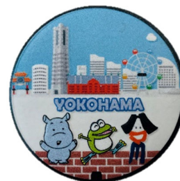
グッズイメージ (缶バッチ)