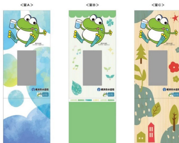
デザイン投票の3案