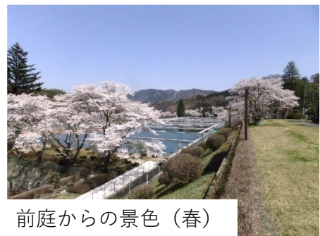
前庭からの景色(春)