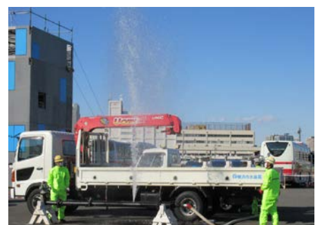
【応急復旧デモンストレーション】

中村ウォータープラザ内の管路研修施設で消火栓からの応急給水作業、応急復旧作業等を実演します。