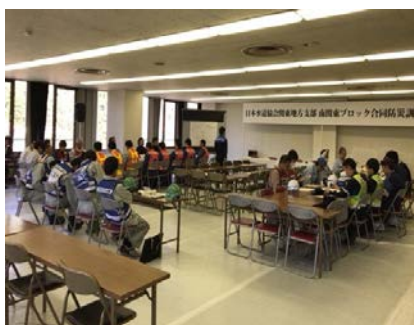
【応援活動審議訓練】

本市から各応援都市へ被害状況や応急給水要請状況等の説明をし、応急給水地点を割り当てます。