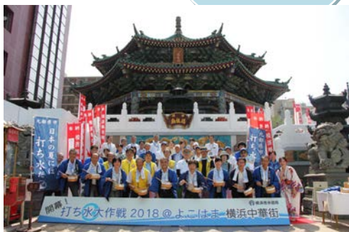
昨年度の式典の様子

はじめ式参加者（予定）☞ 水道局長、中区長、温暖化対策統括本部長、横浜中華街発展会理事長、 打ち水大作戦本部、メタウォーター株式会社、株式会社ファンケル