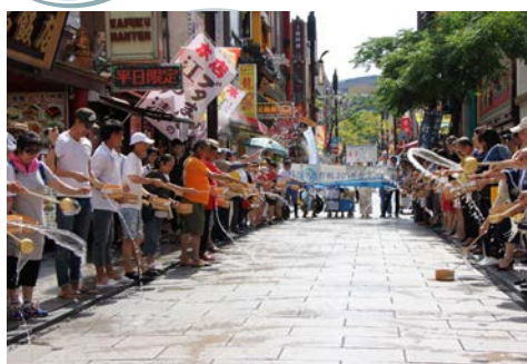
中華街大通りで打ち水