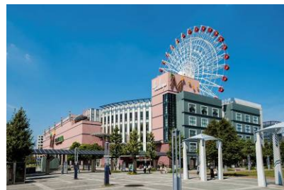
モザイクモール港北

*打ち水大作戦…二次利用水等を用いた打ち水のこと。2003 年から始まり、打ち水大作戦本部(事務局: 特定非営利活動法人 日本水フォーラム)が毎年全国に実施を呼びかけている、全国規模の市民運動。誰もが手軽に楽しくできる地球温暖化対策の取組で、気温を下げる効果や環境意識の啓発などの効果がある。貴重な水資源の保持のため、水道水ではなく、雨水やお風呂の残り湯などの二次利用水を使うこととしている。