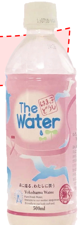
はまっ子どうし The Water ピンクリボンボトル