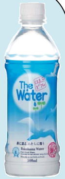
はまっ子どうし The Water レギュラーボトル

また、売上げの一部を環境貢献や国際支援のために寄附するなど、環境にやさしい社会づくりに貢献しています。