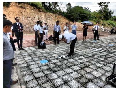
テクニカルツアーでの漏水調査の実演