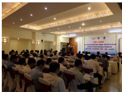
水ビジネス推進セミナーの様子

なお、7月6日（木）には、本覚書に基づく初めての事業として、横浜水ビジネス協議会会員企業6社が参加した「水ビジネス推進セミナー」を横浜市水道局、横浜水ビジネス協議会、フエ省水道公社の共催により、フエ省で開催しました。ベトナム国の水道事業者等からも58団体165人の参加者が集まり、同会場で行われた展示会、その後のテクニカルツアーも多くの参加者で賑わいました。