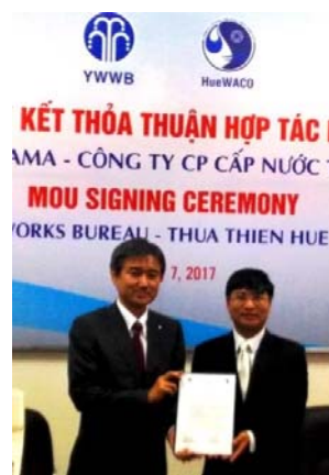
覚書締結記念式典の様子

※ 上下水道の海外水ビジネス展開に関し、情報共有やプロモーション等を行うために平成23年に設立された市内企業等による会員組織。29年6月時点で164社が登録。