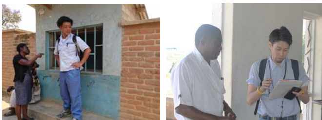
平成 28 年度派遣者の現地活動の様子