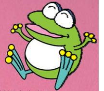
横浜市水道局キャラクター「はまピョン」