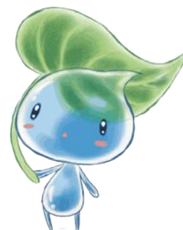
菊名ウォータープラザまつり キャラクター「みーず」

横浜市は明治30（1897）年に道志川から取水を始め、大正5（1916）年に道志村の山林を山梨県から購入し、「道志水源林」として管理・保全を開始しました。今年は100年の節目の年にあたります。横浜市ではこれを記念して各種のイベントを行っています。