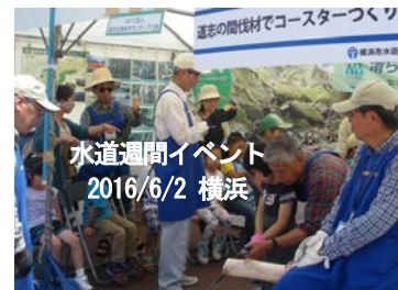
「水源かん養林の大切さを」 普及・啓発活動