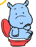
横浜市水環境 キャラクター かぼのだいちゃん

水道局小雀浄水場は昭和40（1965）年に完成し、拡張・技術の変遷等の歴史を経て、平成27（2015）年に創設50年を迎えました。これを契機に、今年は小雀浄水場でさまざまな企画を展開しています。 今回は環境創造局西部水再生センターとともに上下水道施設の合同見学会を行います。大船駅を出発し、小雀浄水場で水道水の製造過程、西部水再生センターで生活排水等がきれいな水に再生される過程を見学していただきます。ゴールの藤沢駅までの約10kmを歩くウォーキングイベントとなっています。 また、現在横浜市では「よこはまウォーキングポイント」事業を実施しています。この事業に参加されている方は、今回のイベントを通じてポイントを貯めるチャンスです！奮ってご応募ください！