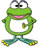
横浜市水道局 キャラクター 「はまピョン」