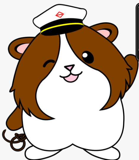
横浜市危機管理室公式キャラクターみなモル

この場所は、最悪の場合、洪水による浸水が発生して、 その深さが0.5メートルから3メートルになることが 想定されています。