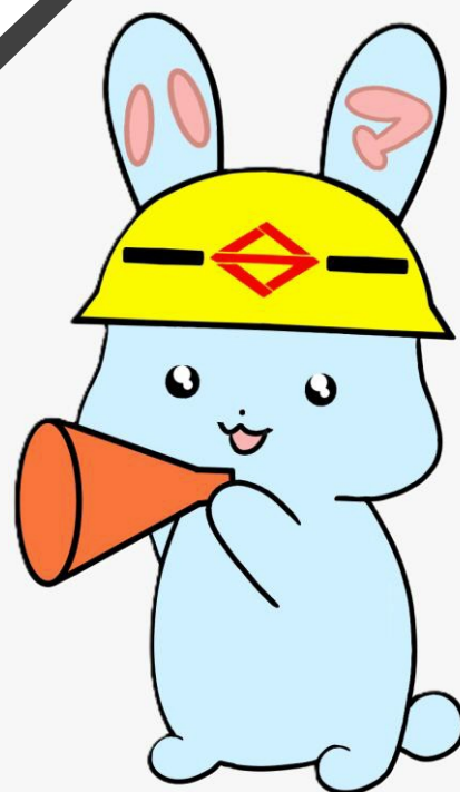
横浜市危機管理室公式キャラクターハマらび