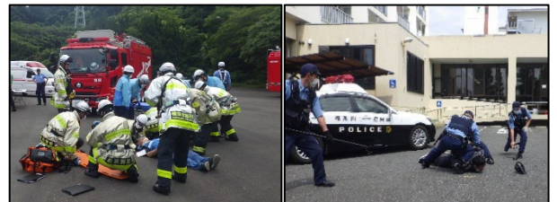
【過去の訓練の様子】