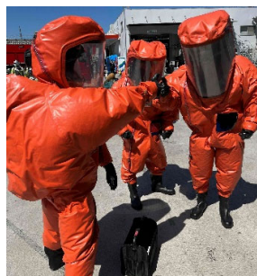
【過去の訓練の様子】