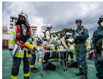
過去の訓練の様子