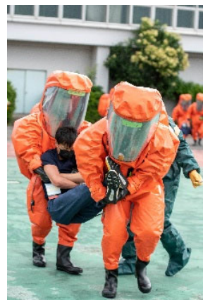
過去の訓練の様子