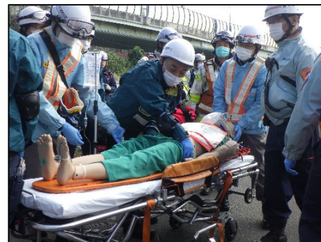
昨年度の訓練の様子