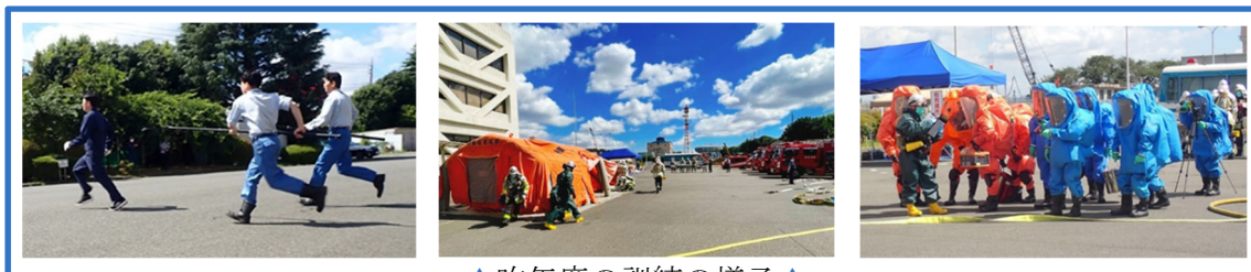
▲昨年度の訓練の様子▲