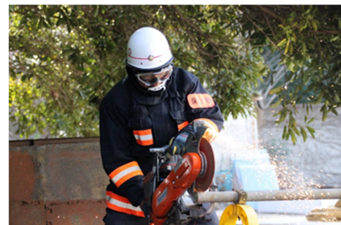
エンジンカッター取扱訓練の様子