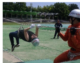
救助訓練を体験する参加者

※本特典は、横浜市内在住の方も対象となります。市外在住の寄附者の方は、寄附額に応じた返礼品に加え、本特典のお申込みが可能です。