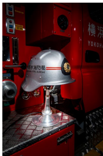
アップサイクル消防ヘルメットテーブルランプ