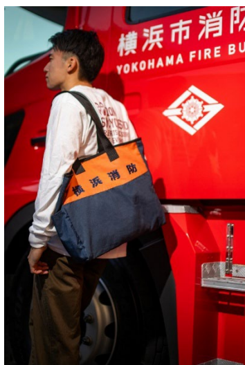
アップサイクルトートバッグ（活動服）

このたび、全国から寄せられたご好評を受け、活動服や消防ヘルメットをアップサイクルした2つの返礼品を新たに提供開始します。製品一つひとつに、市民を守り抜いた証が残る、世界に一つだけの返礼品です。今後も当返礼品を通じて、全国の方々にも横浜の安全・安心を発信していきます。