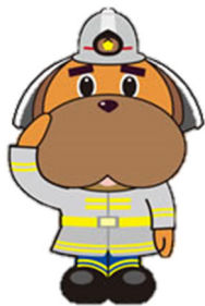
横浜市消防局 マスコットキャラクター ハマくん