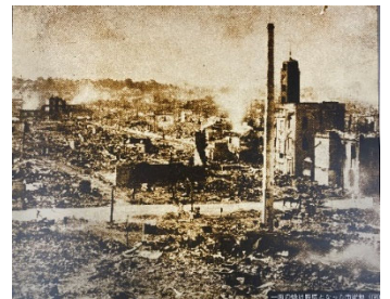
一面の焼け野原となった市街地