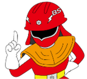
広報宣隊「防センジャー」