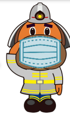
横浜市消防局 マスコットキャラクター 「ハマくん」

市民の皆様が安心して年末年始を過ごせるよう、 出火防止・予防救急の広報、消防車による地域巡回、 そして新型コロナウイルス感染拡大を見据えた体制を確保する 「年末年始消防特別警戒」を実施します。