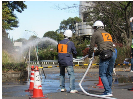
初期消火器具訓練風景（令和3年度）