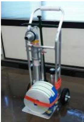
スタンドパイプ式 初期消火器具