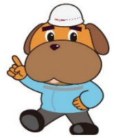
横浜消防マスコットキャラクター「ハマくん」