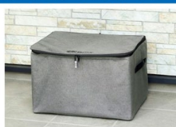
折り畳み式でコンパクトタイプ