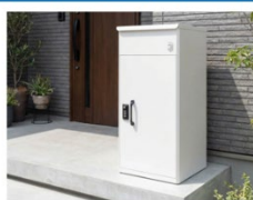
常設型で、複数回荷物を受け取れるタイプ