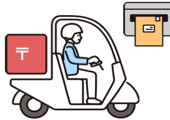
③商品券を受け取り