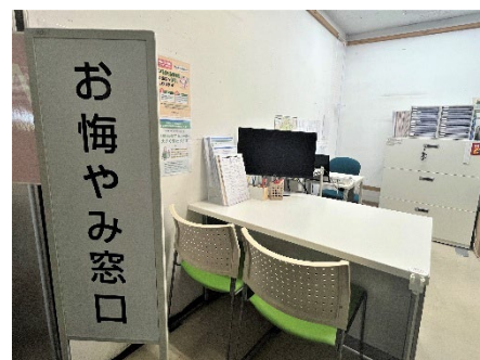
<鶴見区お悔やみ窓口>

ご遺族の方々からは、「お悔やみ窓口スタッフがいなかったら、手続きに何倍もの時間を要していたと思う。本当に助かった。」「手続きが続く中、寄り添っていただけて精神的に安心して進められた。」といった声が寄せられています。