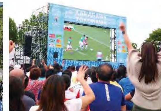
ラグビーワールドカップ2019™ファンゾーン