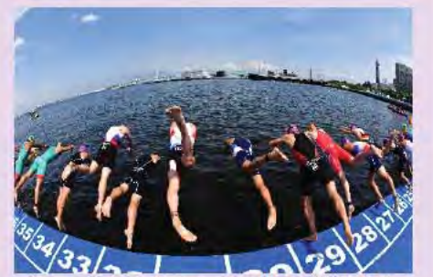
ワールドトライアスロンシリーズ横浜大会

関内・関外地区について、居心地が良く歩きたくなる空間を目指し、社会実験の結果を踏まえた道路や公共空間の整備を進めます。また、スポーツイベントと絡めた取組を行い、周知します。