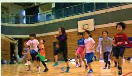
キッズトライアスロン教室

学校や地域にスポーツ指導者を派遣し、スポーツ教室の事業等を行います。部活動指導員の配置は引き続き進め、地域移行の可能性も含めて検討するなど、部活動を持続可能なものとするための取組を進めます。小学校及び中学校の学校施設においては、計画的かつ効果的な施設の保全や空調設備の整備を進めます。