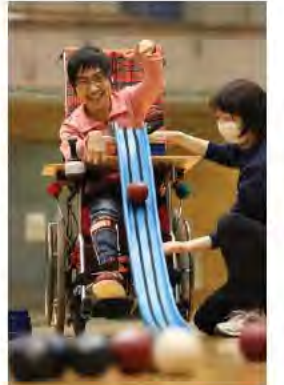
横浜市障害者スポーツ大会(ハマビック)