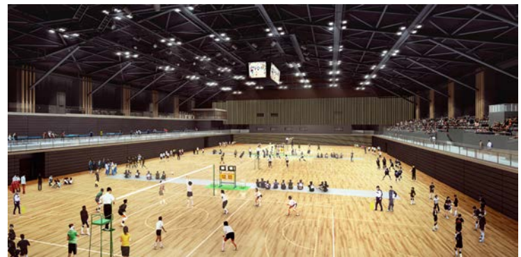
< 2階アリーナ >

※画像はイメージ図です。