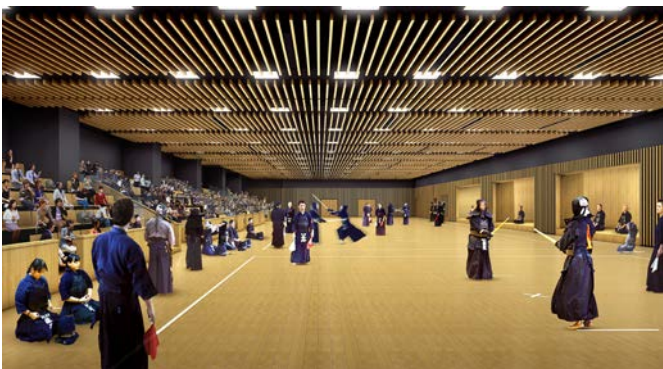
< 1階武道場 >