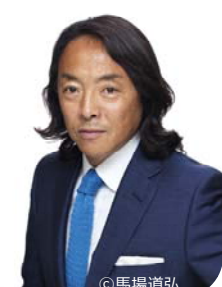
きたざわ つよし 北澤 豪さん (日本障がい者 サッカー連盟会長)