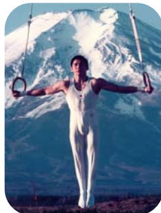
くしけん こうじ 具志堅 幸司さん (体操)