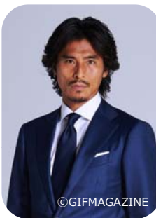
なかざわ ゆうじ 中澤 佑二さん (サッカー)