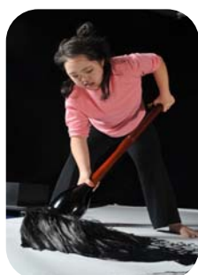
かなざわ しょうこ 金澤 翔子さん (書家)