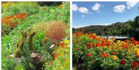
会期中の「里山ガーデンフェスタ」の様子