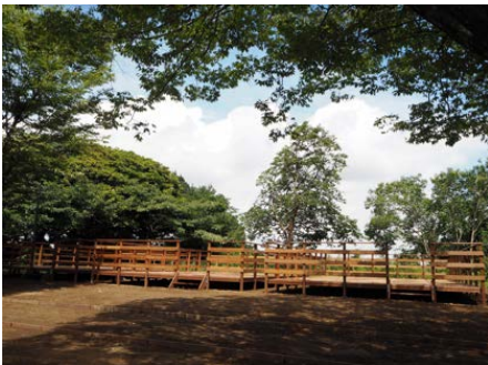
テントサイトのウッドデッキ