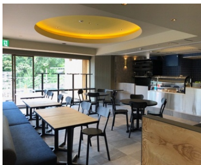
2階カフェレストラン店内写真