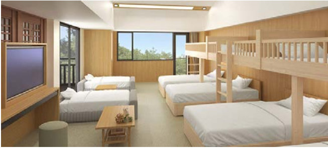
スタンダードルーム