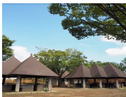
アウトドアフィールド