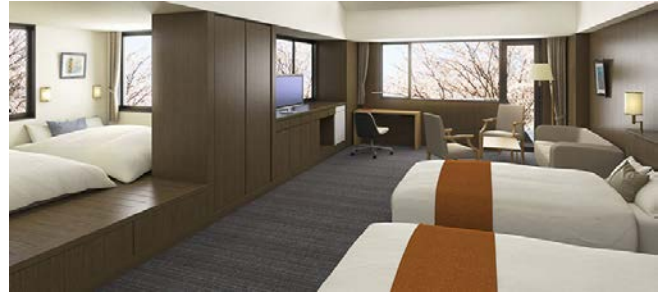
エグゼクティブルーム

横浜市上郷・森の家は横浜市内の体験学習だけでなく、市民の方にも愛されてきた施設です。今回のリニューアルでは、現代の生活様式に合わせてベッドを取り入れ、快適性を高めました。