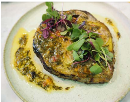
マグロのステーキ