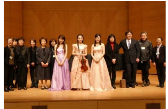
第135回ふれあいコンサートの様子