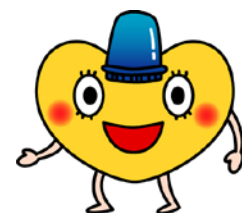
「パト・ハート」 横浜市子どもの安全 シンボルマーク

「サイバー子ども安全教室」の取材を御希望の方は、事前に下記お問合せ先に御連絡ください。