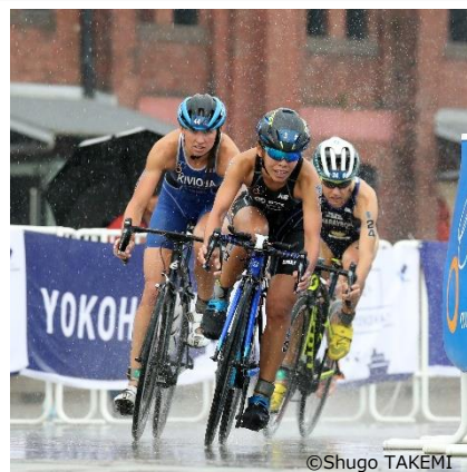
上田藍 -Ai Ueda- (写真中央) リオデジャネイロオリンピック日本代表 2016年 世界トライアスロンシリーズ横浜大会 3位 2016年 ITU世界トライアスロンシリーズ 年間ランキング 3位

本大会の詳細は、大会HPをご確認ください。 https://yokohamatriathlon.jp/wts/