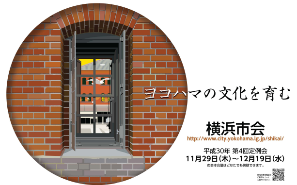
平成 30 年第 4 回定例会