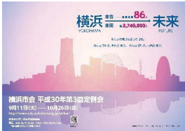
平成 30 年第 3 回定例会