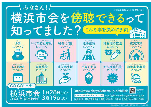
平成 31 年第 1 回定例会