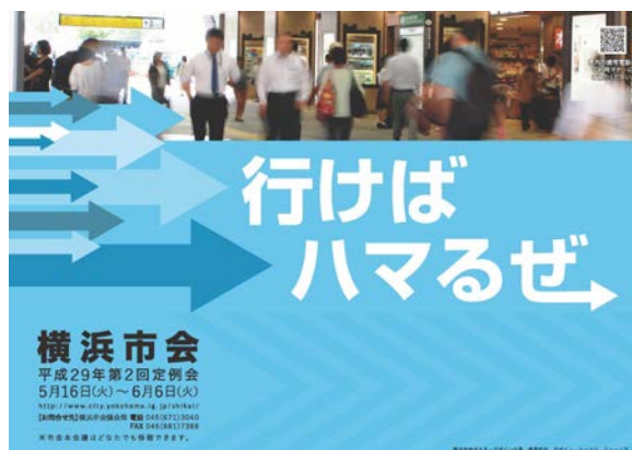
平成 29 年第 2 回定例会