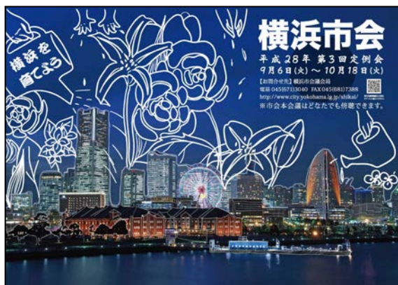
平成 28 年第 3 回定例会