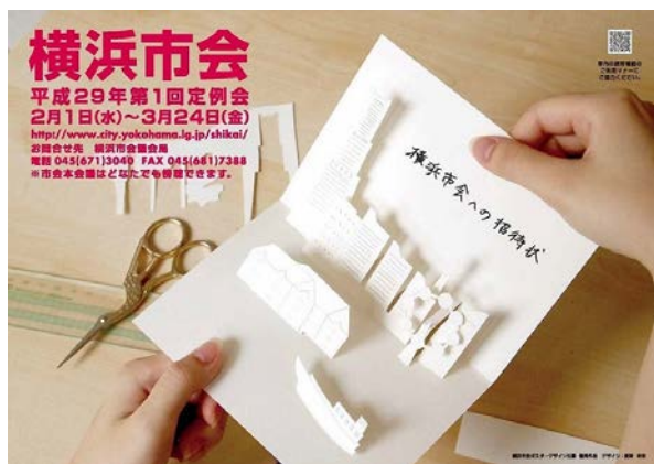
平成 29 年第 1 回定例会