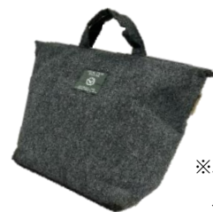
※バッグ型コンポスト イメージ