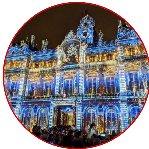
冬の風物詩「光の祭典」 リヨンの市庁舎の様子

リヨンは、絹と美食で知られるフランス第二の都市。 古くから絹織物産業が発展していましたが、 19世紀に欧州でカイコの病気が広まり、絹の入手が困難に。 その危機を救ったのが、横浜港から輸出された日本の生糸。 絹がとりもつ縁によって友好関係を築いてきた両市は、 1959年に姉妹都市の提携に至り、2024年に65周年を迎えました。 そして瀬谷区は、かつては絹の一大生産地。 絹の縁で結ばれた瀬谷とリヨンが、百年の時を超えてつながります。